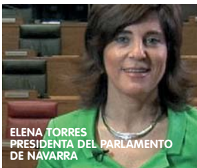
ELENA TORRES PRESIDENTA DEL PARLAMENTO DE NAVARRA

"El Orfeón Pamplonés es nuestra voz en el mundo y será nuestra voz en Europa 2016"