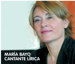
MARÍA BAYO CANTANTE LÍRICA

"En 2016, Pamplona podrá compartir y regalar a todo el mundo su gran legado histórico, artístico y humano. Y allí estaré para celebrarlo"