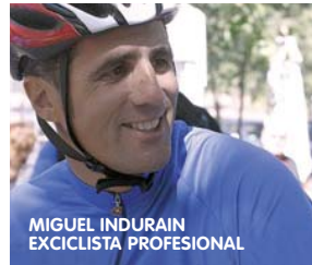
MIGUEL INDURAIN EXCICLISTA PROFESIONAL

"La gastronomía es la expresión de encuentro amistoso ante una mesa. Estaría muy orgulloso de que mi ciudad fuera Capital Europea de la Cultura"