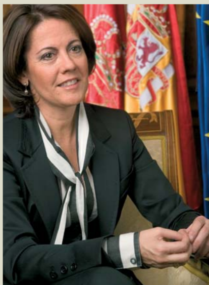
Yolanda Barcina ALCALDESA DE PAMPLONA

Pamplona es una ciudad que a lo largo de su historia milenaria ha ido acumulando un rico acervo cultural entre el que destaca su patrimonio de encuentro festivo, un legado de presente y de futuro que queremos compartir con Europa porque estamos convencidos de que puede ayudarnos a construir un futuro mejor.